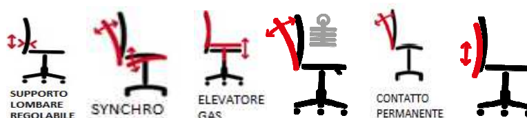
le immagini sono rappresentative dei movimenti delle sedute

Meccanismi Elevazione a gas; - regolazione Up-DOWN ; - Meccanismo synchro tra sedile e schienale e contatto permanente antishock; -