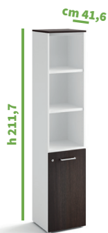
cm 45 cod. M1263X |