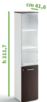
cm 45 cod. M1283X |