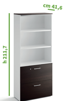
cm 90 cod. M1266X |