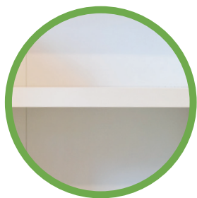
RIPIANI ANTIFLESSIONE IN ALTO SPESSORE MM 28