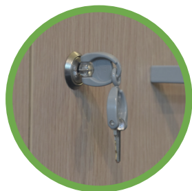
SERRATURA È DI SERIE