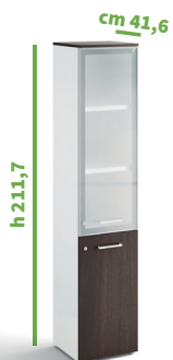
cm 45 cod. M2283X |