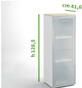
cm 45 cod. M2164X |