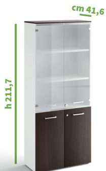
cm 90 cod. M1281X |