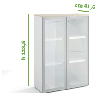
cm 90 cod. M2162X |