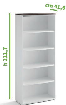
cm 90 cod. M1271X |