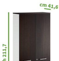
cm 45 cod. M1296X |