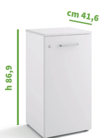
cm 45 cod. M1054X |