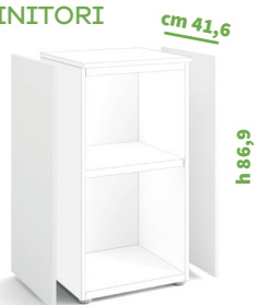
cod. C4050X |