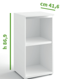
cm 45 cod. M1053X |