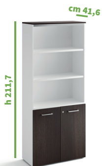
cm 90 cod. M1261X |