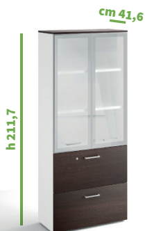
cm 90 cod. M2286X |