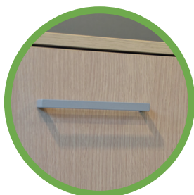
MANIGLIA A PONTE