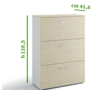
cm 90 cod. M1156X |