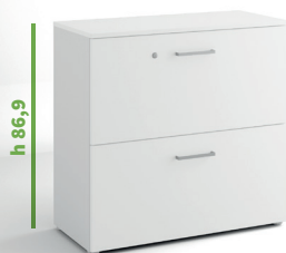
cm 90 cod. M1056X |