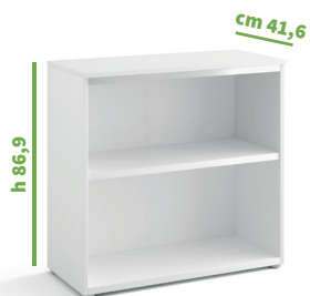
cm 90 cod. M1051X |