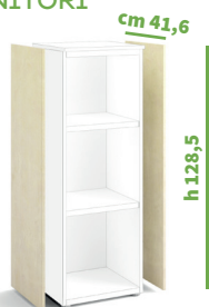
cod. C4060X |