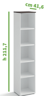
cm 45 cod. M1273X |