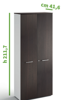
cm 90 cod. M1291X |