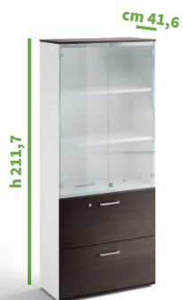
cm 90 cod. M1286X |