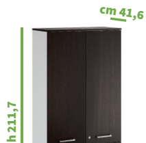
cm 90 cod. M1292X |