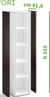
cod. C4070X |