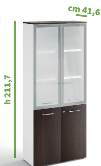
cm 90 cod. M2281X |