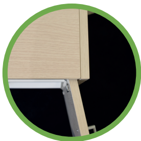
APERTURA ANTE 110 GRADI