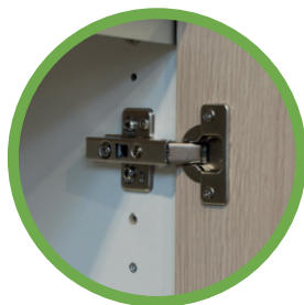
ANTA AD AGGANCIO RAPIDO SENZA ATTREZZI