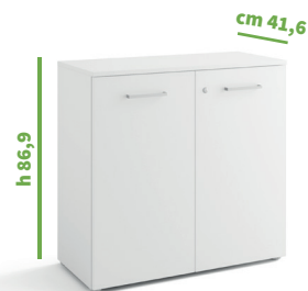
cm 90 cod. M1052X |